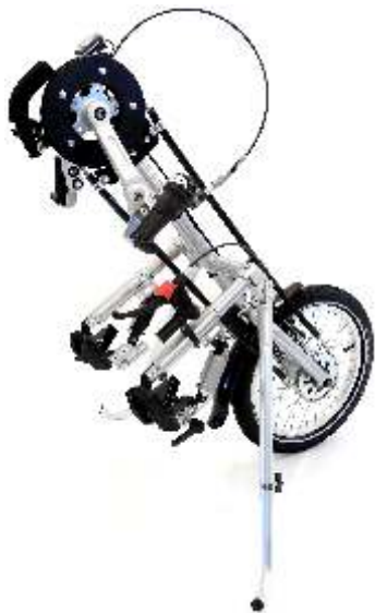
CITY KID CE