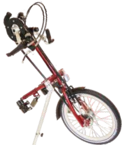
CITY JUGEND CE