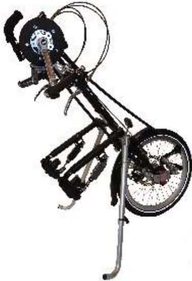
CITY COMPACT CE